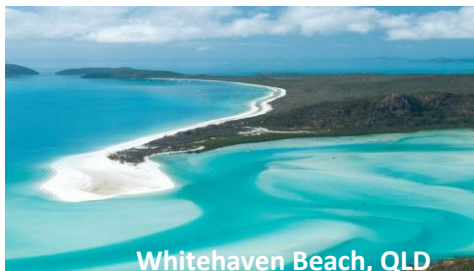
Whitehaven Beach, QLD

Laura 在本中心工作了两年半，最近被任命为本中心负责人。她喜欢和本地居民见面，一起商讨如何营建中心，组织并扩展各项活动。左面这张照片拍摄的是她很想去的海边。希望情势快快好转，出州旅行成为可能 ☺